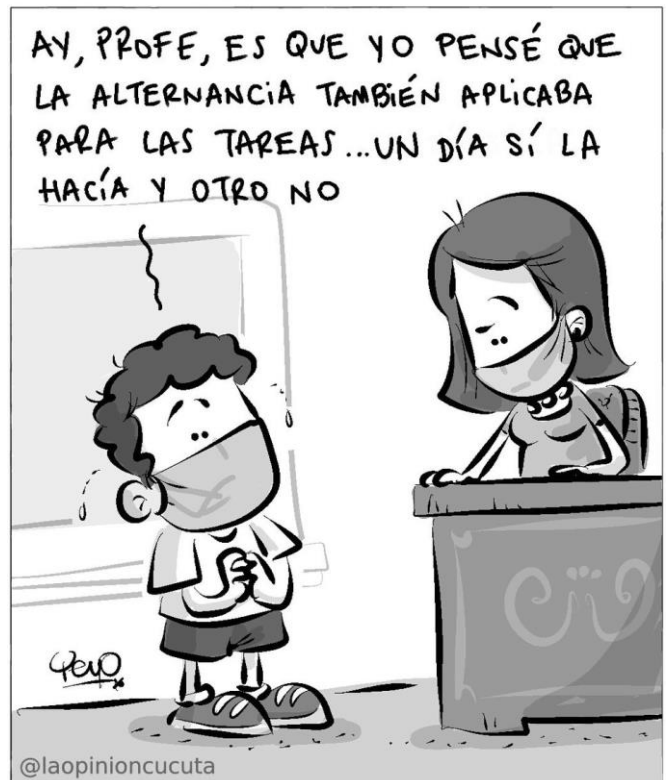
Caricaturista: YEYO Nacionalidad: Colombiano