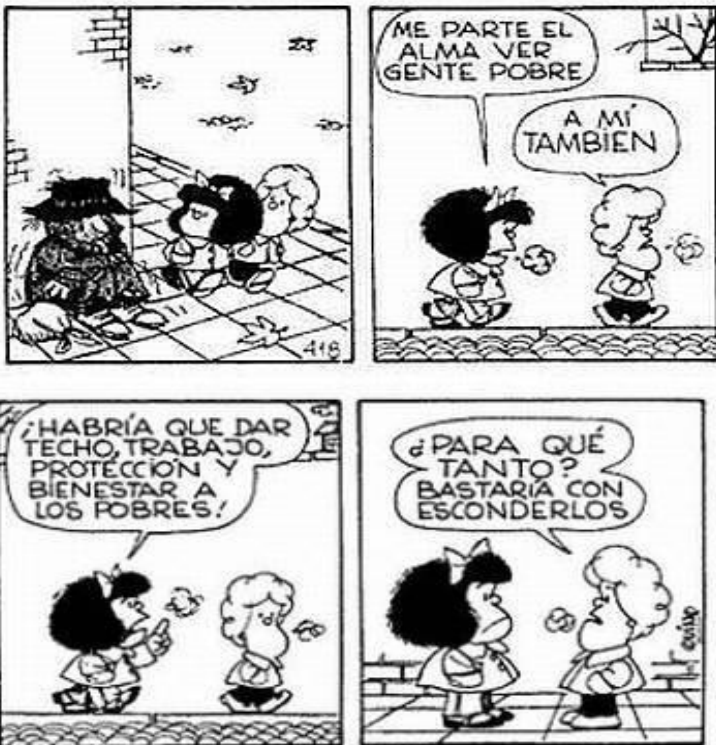
Autor: Quino Nacionalidad. Argentino