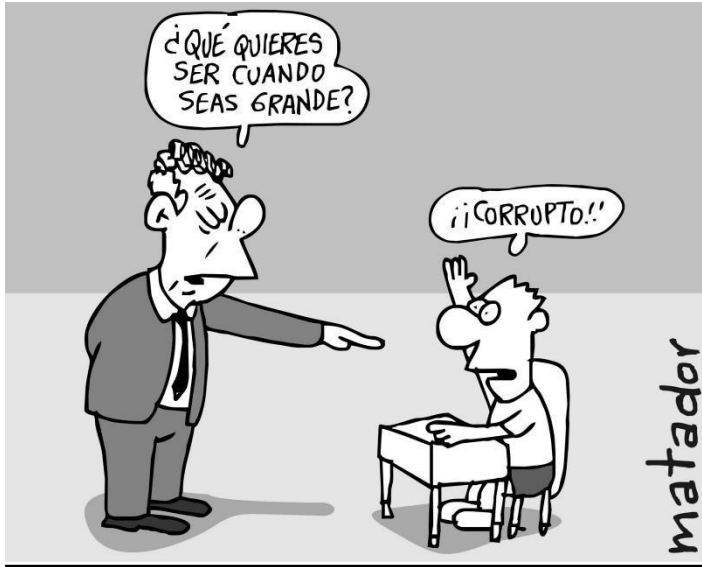
Caricaturista: Matador Nacionalidad: Colombiano